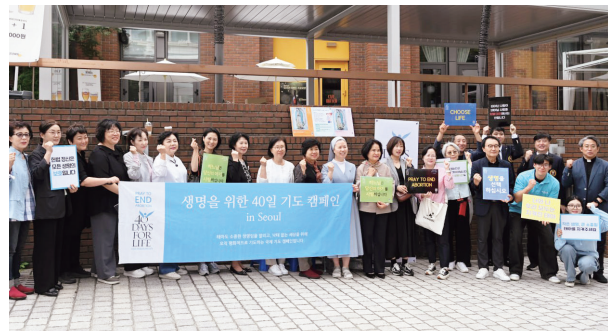
그리스도께서는 평신도들을 통하여 세상에 구원의 빛을 비춘다. 생명을 위한 40일 기도 운동 현장

또한 평신도들은 풍습을 죄악으로 몰아가는 세상의 제도들을 정의의 규범에 부합하도록 바로잡아, 인간의 활동과 문화에 도덕 가치가 스며들도록 해야 합니다. 그럼으로써 하느님 말씀을 받아들이는 세상이 마련되고 교회의 문이 활짝 열려서, 세상에 평화가 선포되어야 합니다.